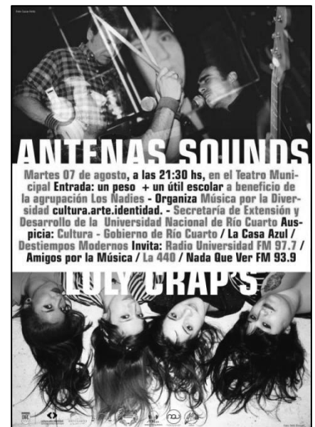
Afiche publicitario de la banda integrada por mujeres, "Loly Crap's".

propicios donde, en la conformación de bandas con una fuerte o total composición femenina, tanto en sus miembros como en las temáticas de las letras, se vislumbra una perspectiva de género consolidada que resulta importante destacar en esta breve reseña.