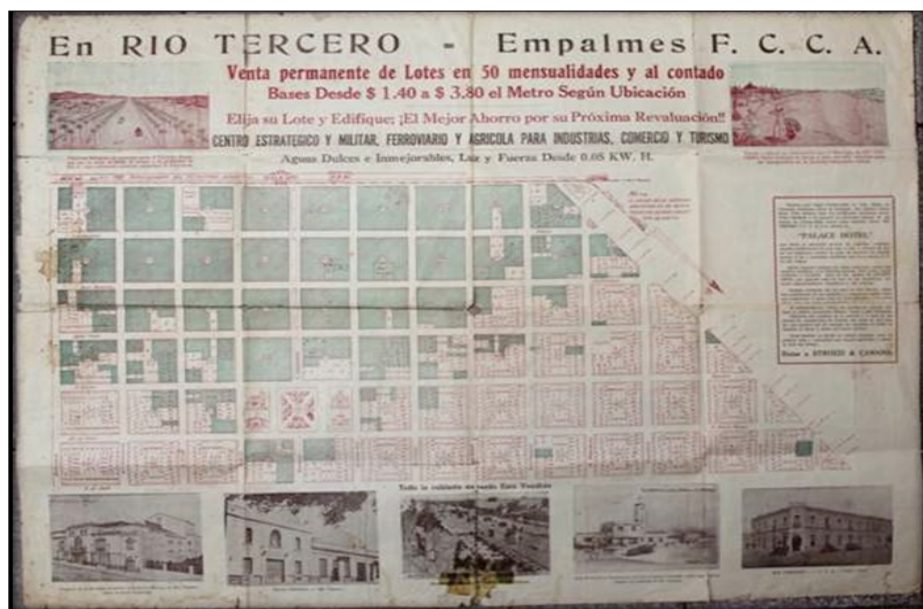
Plano de la ciudad de Río Tercero, Argentina; publicidad del loteo de Pedro Marín Maroto. Años 1943-44.

Por el otro, la llegada del tren propició, también, el arribo masivo de población inmigrante y la ejecución de obras para construir un embalse de riego en el río Tercero 1 . Otro patrón común que puede observarse del trazado del ferrocarril y las estaciones fue que eran proyectadas en propiedades de estancieros locales, lo que les permitió valorizar aún más sus campos; a la vez, que propició el establecimiento de pueblos alrededor de estas estaciones. Siguiendo esta línea y aprovechando estas condiciones