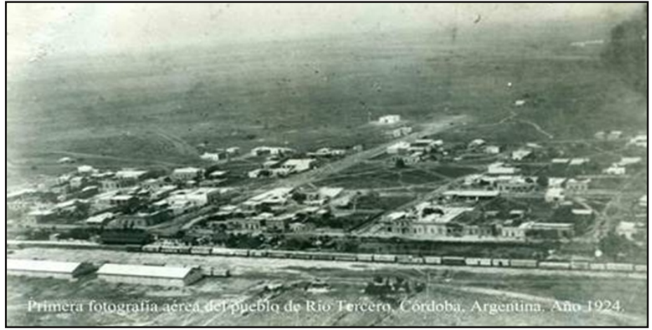
El pueblo de Río Tercero en el año 1924, donde se visualiza la división del espacio por la vía férrea, y en la zona de influencia se ve la ubicación de la urbanización.

Por otra parte, la disponibilidad de electricidad a través de la Cooperativa y el atractivo incentivo económico que proporcionaba la nueva fábrica, motivaron a los descendientes de la familia Acuña-Marín Maroto a impulsar