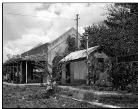
Fachada estación de trenes

Dicen por aquellos tiempos que las tierras fueron donadas por un tal Cleofe Domínguez. Y el pueblo se funda con llegada del tren.