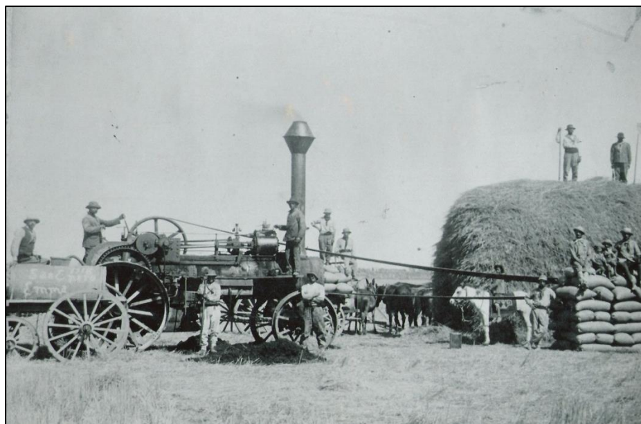
Época de cosecha

Cuando se construyó la línea férrea se decidió ubicar allí una estación a la que se denominó Estación Renca, seguramente por su proximidad a la