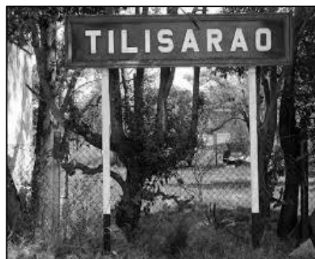
Cartel de ingreso a la estación de trenes

que otras estaciones de la misma línea férrea también habían sido designadas con vocablos de origen indígena.