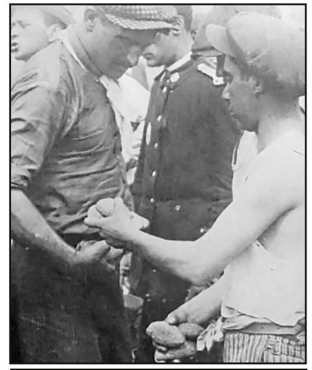
Desayuno para pobres, 1932.

Finalmente, a principios de octubre, se decidió no realizar la olla popular para establecer en su lugar “abundantes distribuciones de carne, galleta y maíz molido”. El reparto se realizaría a través de vales que cada persona debía retirar en la Municipalidad, para luego buscar en el Mercado Este la ración correspondiente consistente en 300 g. de carne, 600 g. de