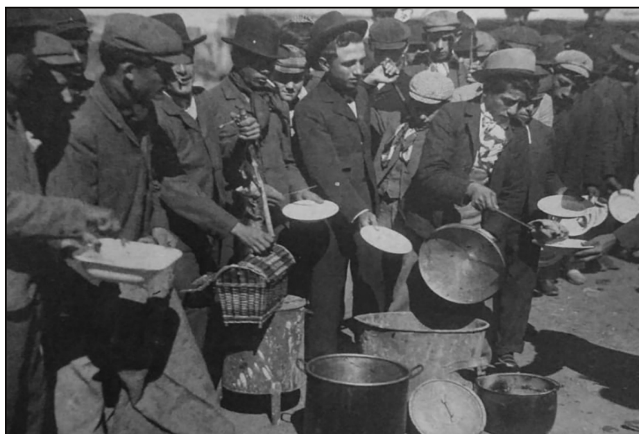
Olla popular en Buenos Aires (1907). Fotografía a modo figurativo

El préstamo pro-desocupados fue presentado en agosto de 1932, cuando el Ejecutivo envió un proyecto al Concejo Deliberante con el fin de contratar un préstamo de $30.000 m/n para destinarlo al arreglo de calles y la construcción de un puente sobre el arroyo en la Av. España