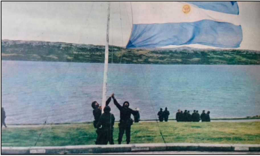
“Foto imperfecta” (titula su autor) – “Tres soldados izan la bandera argentina en el mástil principal, sobre Ross Road, frente al mar, y también frente al mundo”. Gente – Mayo de 1982.