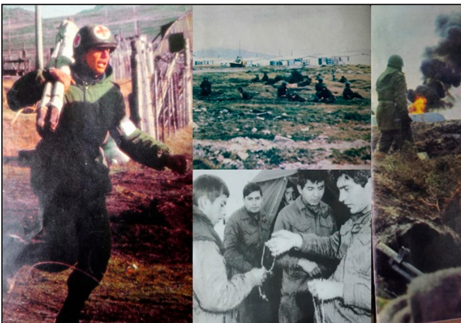
Preocupación por el regreso de los soldados tras perder la guerra. Imágenes de Radiolandia 2000 y El Pueblo.